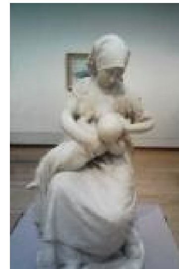
Fonte: "Camponesa amamentando o filho" escultura de Jules Dalou (1838 – 1902) Museu Van Gogh. Amsterdam.

CURSO DE PÓS-LICENCIATURA DE ESPECIALIZAÇÃO EM ENFERMAGEM DE SAÚDE MATERNA E OBSTETRÍCIA